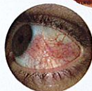
Superior Limbic Keratoconjunctivitis (SLK)