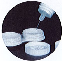
Cuci bekas simpanan setiap minggu.