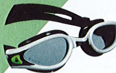
Gunakan goggle semasa berenang