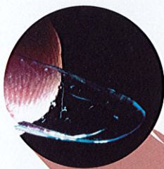
Pakai kanta lekap yang koyak