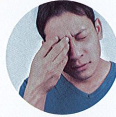
Gosok mata dengan kuat semasa memakai kanta lekap.