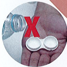
Cuci kanta lekap dengan air paip / air liur