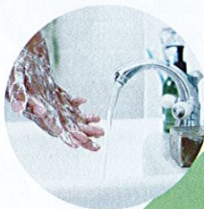
Basuh tangan sebelum mengendalikan kanta sentuh.