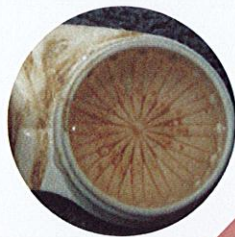
Simpan kanta lekap ke dalam bekas yang kotor