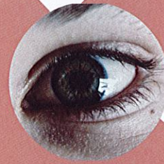
Pakai kanta lekap semasa sakit mata