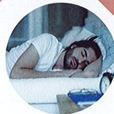
Tidur dengan kanta lekap