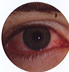
Dapatkan rawatan jika ada : kemerahan, iritasi, penglihatan kabur , sensitif kepada cahaya, airmata berlebihan selepas kanta lekap dikeluarkan.