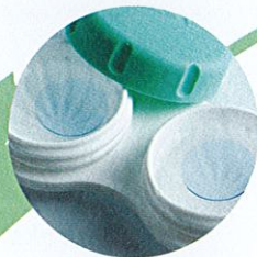
Buang larutan disinfeksi yang telah digunakan.