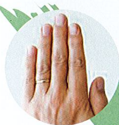
Kuku sentiasa pendek dan bersih.