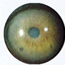
Giant Papillary Conjunctivitis